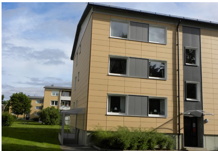
Wohnhäuser in Sundsvall. Steinformat 1200×400 mm